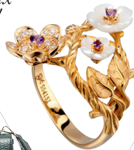
Кольцо из желтого золота с перламутром, аметистами и бриллиантами, Cerezo, Carrera y Carrera, 254 400 руб., Carrera y Carrera