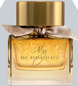
Парфюмерная вода с сияющими частицами My Burberry, Burberry, 90 мл, 11 949 руб., «Л'Этуаль»