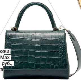
Сумка из кожи и металла, Max Mara, 93 500 руб., Max Mara