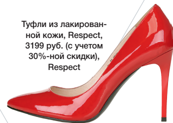
Туфли из лакированной кожи, Respect, 3199 руб. (с учетом 30%-ной скидки), Respect