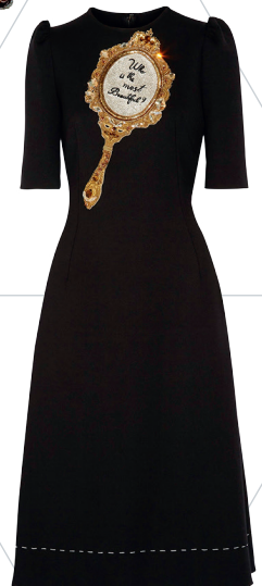
Платье из шерсти, полиамида и эластана, Dolce & Gabbana, 301 500 руб., Dolce & Gabbana