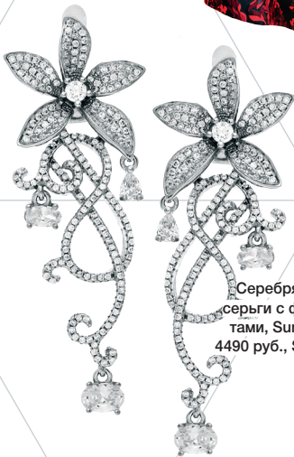
Серебряные серьги с фианитами, Sunlight, 4490 руб., Sunlight