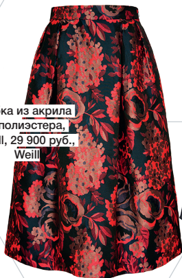
Юбка из акрила и полиэстера, Weill, 29 900 руб., Weill