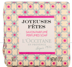
Мыло Joyeuses Fêtes, L'Occitane, 410 руб., L'Occitane