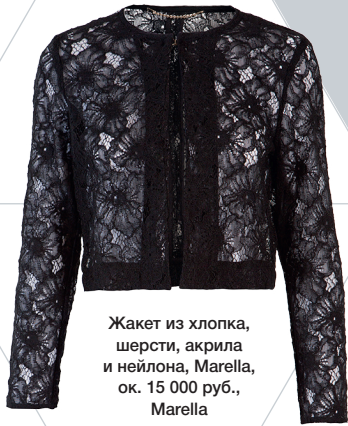
Жакет из хлопка, шерсти, акрила и нейлона, Marella, ок. 15 000 руб., Marella