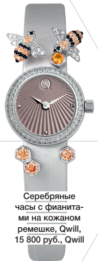
Серебряные часы с фианитами на кожаном ремешке, Qwill, 15 800 руб., Qwill